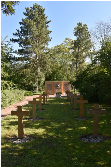
Ehrenfriedhof für Opfer der Zwangsarbeit

Schlagwörter: Grabmal Fachsicht(en): Denkmalpflege Gemeinde(n): Schkopau Kreis(e): Saalekreis Bundesland: Sachsen-Anhalt