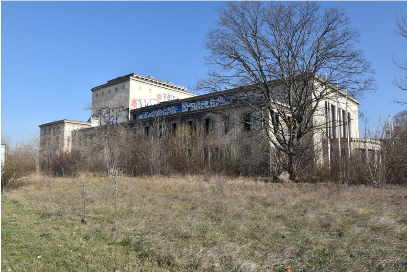
Kulturhaus Schkopau