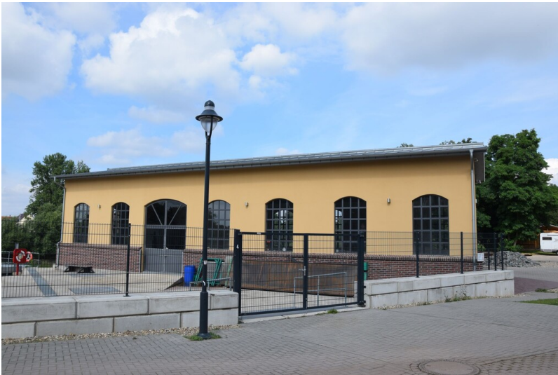
Elektrizitätswerk Bad Dürrenberg