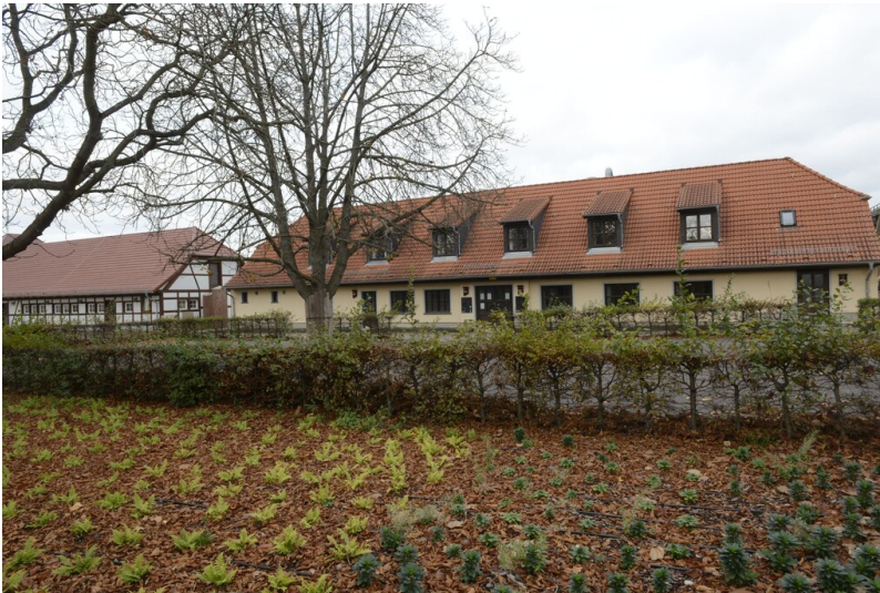
Wirtschaftsgebäude der Saline