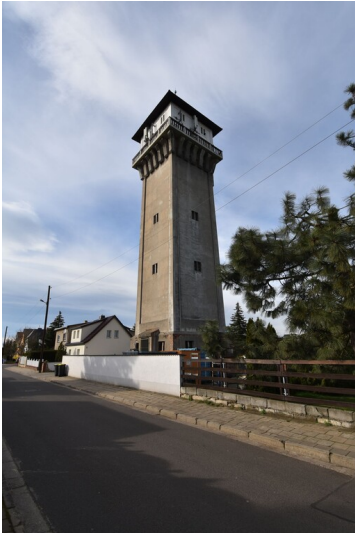
Alter Wasserturm - Alter Wasserturm Bad Dürrenberg