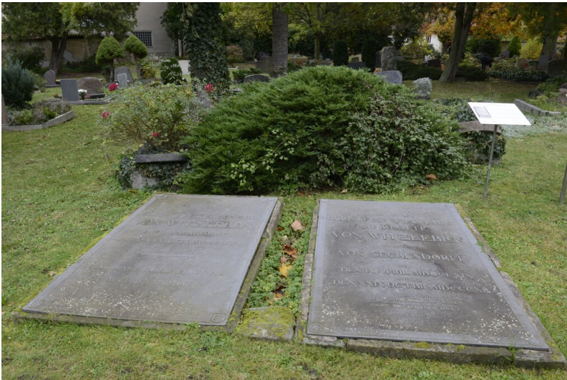
Friedhof Bad Dürrenberg