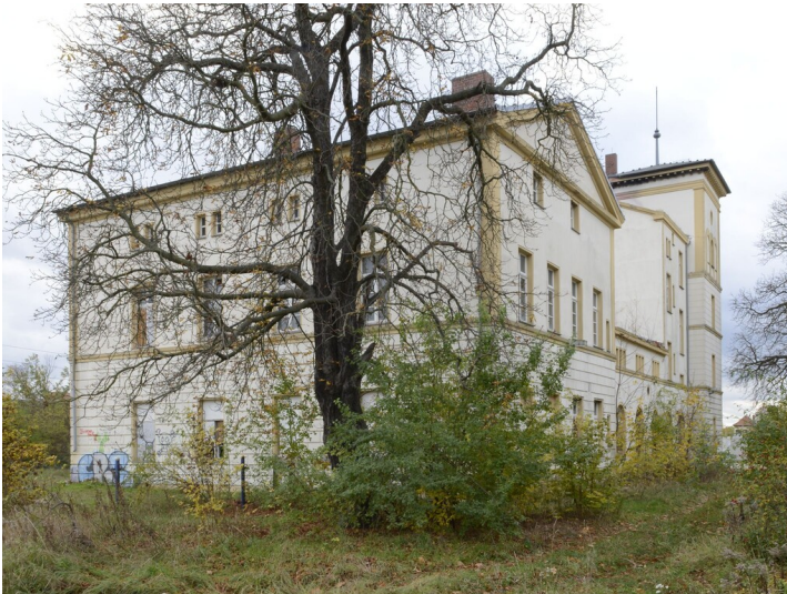
Bahnhof Bad Dürrenberg