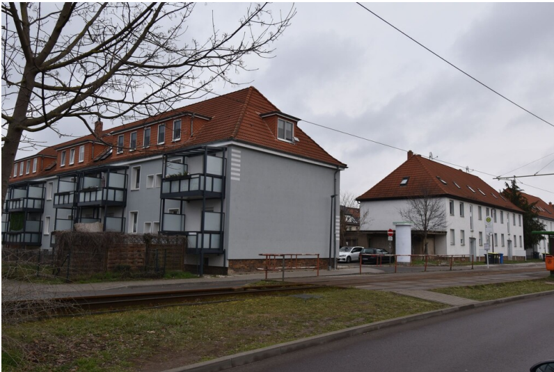
Siedlung "Exerzierplatz" - An der Naumberger Straße