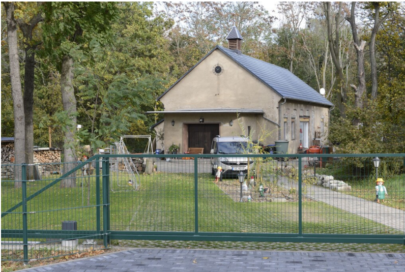
Evangelische Christuskirche Merseburg-Süd