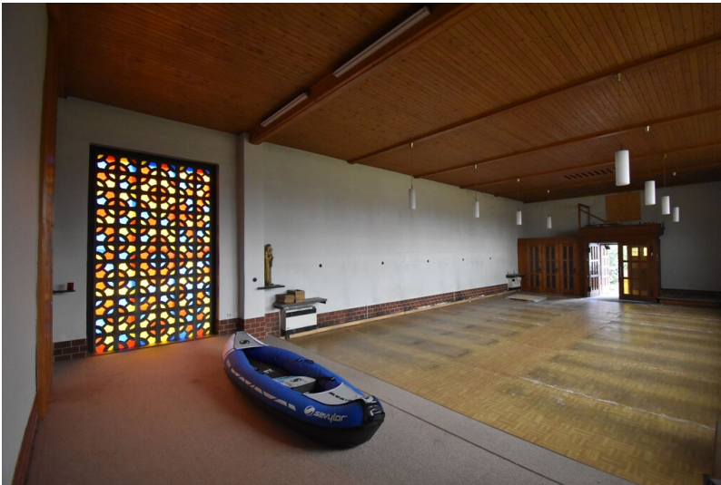
Katholische Kirche St. Ulrich Merseburg-Süd