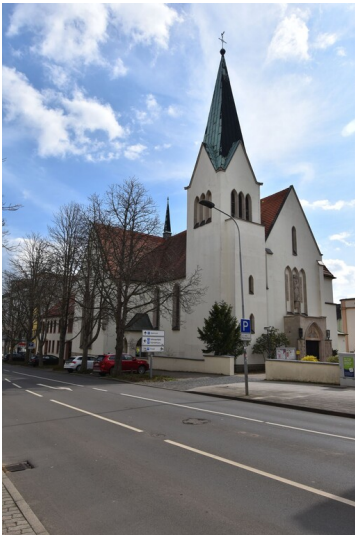
Katholische Kirche St. Norbert Merseburg