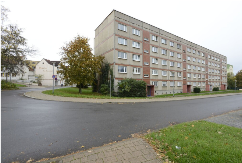
Siedlung Unteraltenburg