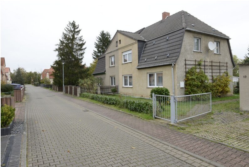
Rentenguts-Siedlung I Fotograf/Urheber: NAME FEHLT