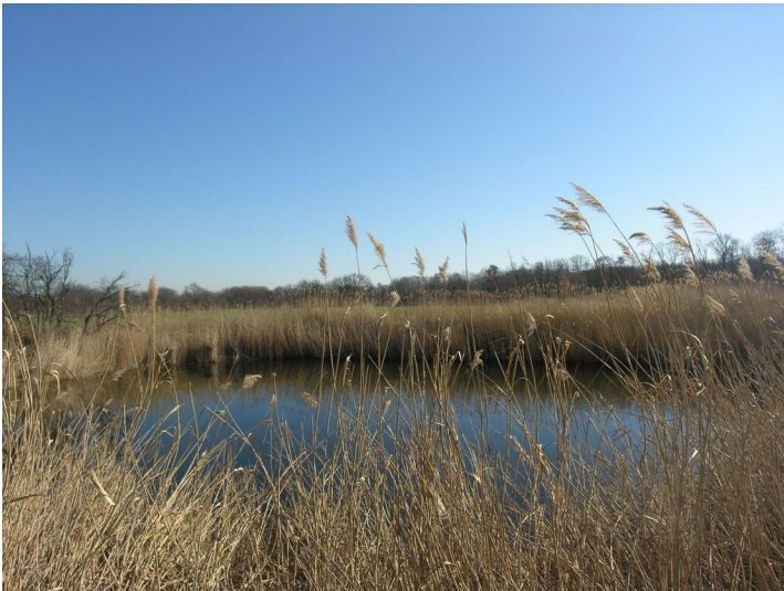
Unbenannte Tagebaugrube - Tagebaurestloch mit schilfbestandenem Teich; Blick E

Schlagwörter: Tagebau Fachsicht(en): Denkmalpflege Gemeinde(n): Schkopau Kreis(e): Saalekreis Bundesland: Sachsen-Anhalt