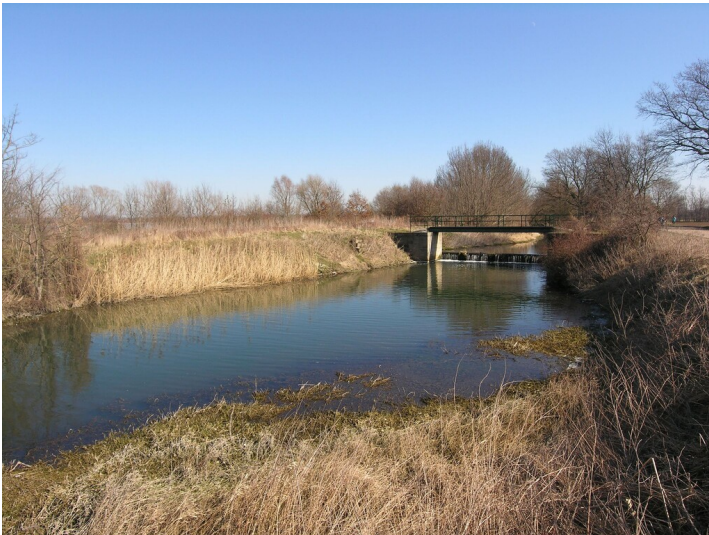
Verlegung der Luppe für den Tagebau Merseburg-Ost - die Luppe im neuen Bett; Blick E