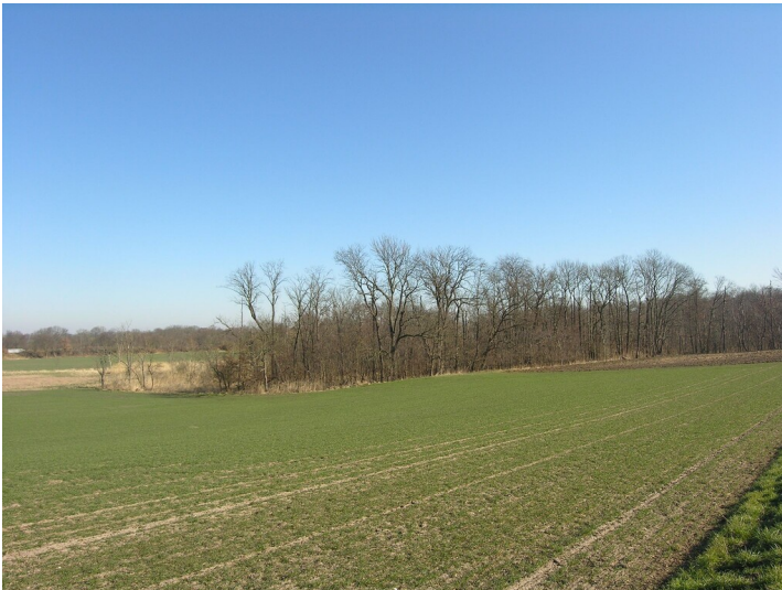
Tagebau der Königlichen Grube Nr. 2 - das bewaldete Tagebauareal aus westlicher Richtung gesehen