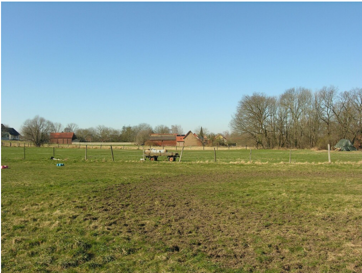
Tagebaugrube ohne Namen - das verfüllte Tagebaugelände; Blick W

Schlagwörter: Tagebau Fachsicht(en): Denkmalpflege Gemeinde(n): Schkopau Kreis(e): Saalekreis Bundesland: Sachsen-Anhalt