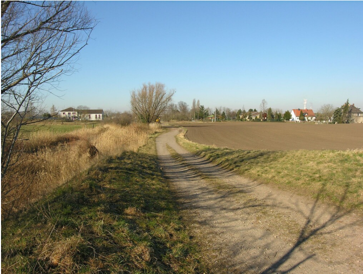
Tagebaugrube der Grube 1 Louise - Das Abbaufeld der Grube 1 Louise, verfüllt und rekultiviert; Blick W

Schlagwörter: Tagebau Fachsicht(en): Denkmalpflege Gemeinde(n): Schkopau Kreis(e): Saalekreis Bundesland: Sachsen-Anhalt