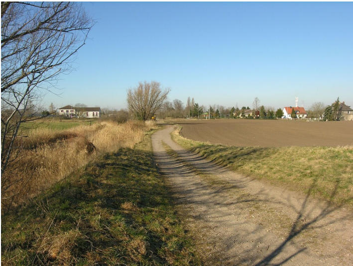
Tagebaugrube der Grube 1 Louise - Das Abbaufeld der Grube 1 Louise, verfüllt und rekultiviert; Blick W

Schlagwörter: Tagebau Fachsicht(en): Denkmalpflege Gemeinde(n): Schkopau Kreis(e): Saalekreis Bundesland: Sachsen-Anhalt