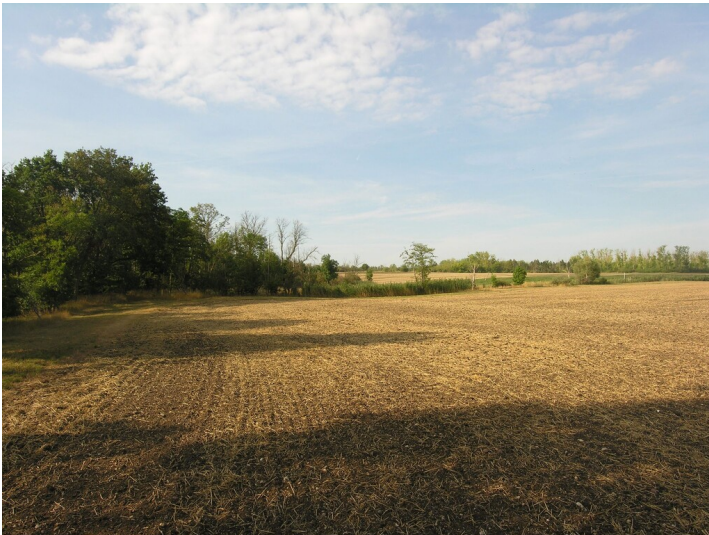
Ältere Tagesanlagen der Königlichen Grube - Situation ehemaliger Tagesanlagen und Kohleformerei; Blick S