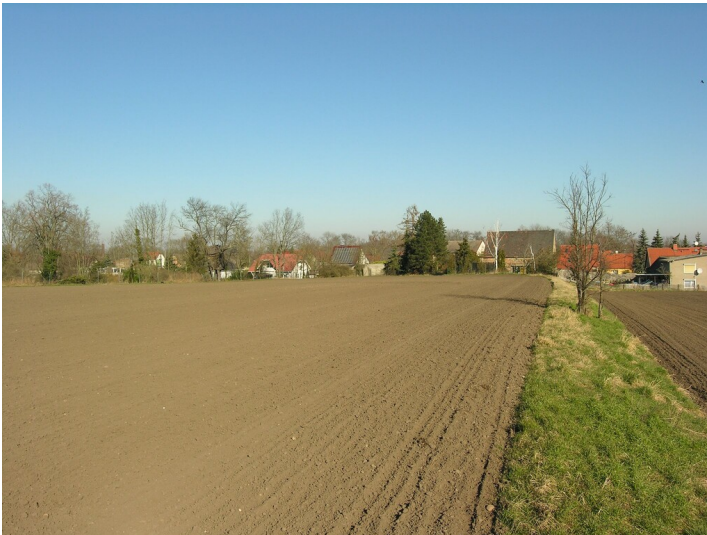
Vermutliche Tagesanlagen der Grube 1 Louise - Vermutliche Situation der Tagesanlagen Grube Louise; Blick N