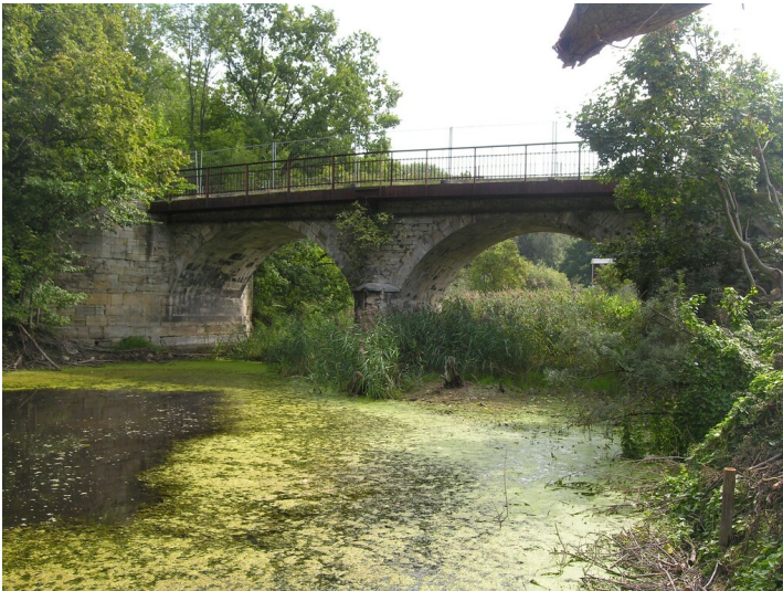
Elsterbrücke - die alte Elsterbrücke bei Burgliebenau; Blick E