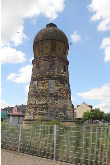
Eisenbahnwasserturm in Merseburg