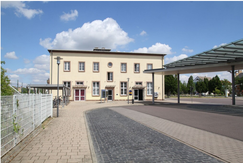
Bahnhof Merseburg