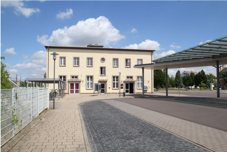
Bahnhof Merseburg