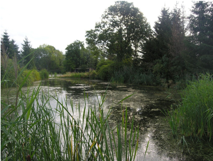
Kohlegruben bei Zscherneddel - Teiche in den "Thonlöchern"; Blick E