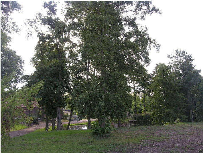
Die Thonlöcher - das westliche ""Thonloch"", am Ortsrand; Blick SE

Schlagwörter: Tagebau Fachsicht(en): Denkmalpflege Gemeinde(n): Leuna Kreis(e): Saalekreis Bundesland: Sachsen-Anhalt