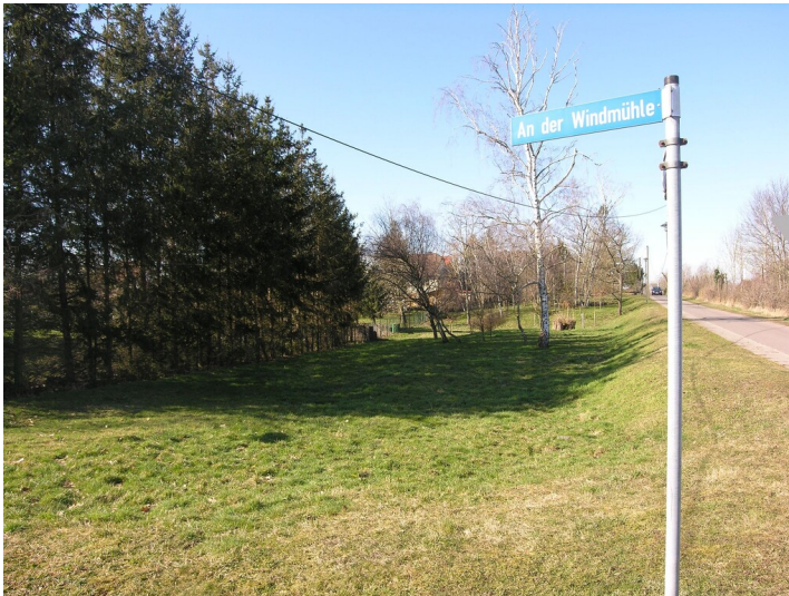
Älteste Grube bei Zöschen - abgesenktes Gelände an Stelle des verfüllten Tagebaus; Blick W