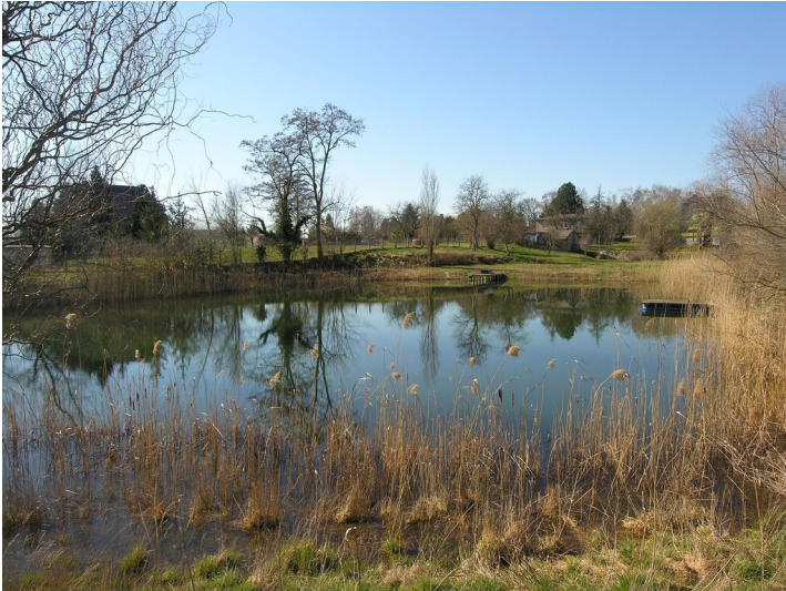
Separates Tiefbauareal der Grube Zöschen - durch Kiesabbau überformtes Gelände darunterliegender Bruchfelder; Blick SW