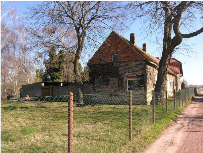
Schacht, Tagesanlagen und Fabrik der Grube Zöschen - Wohn- und Wirtschaftsgebäude der Fabrik Grube Zöschen, "Am Schachtteich"; Blick E