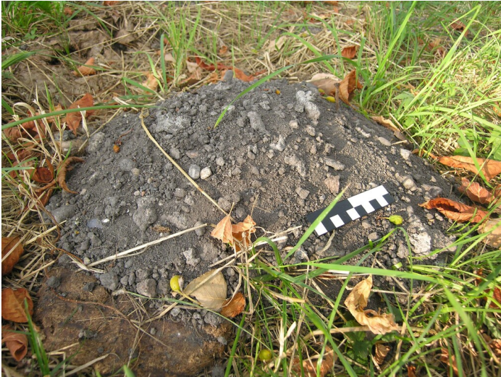
Aschenberg der Siedehäuser - Oberflächenfunde, Asche mit Schlacke im Maulwurfshaufen; Maßstab dl-by-de/2.0 cm