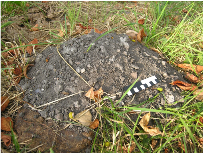
Aschenberg der Siedehäuser - Oberflächenfunde, Asche mit Schlacke im Maulwurfshaufen; Maßstab dl-by-de/2.0 cm