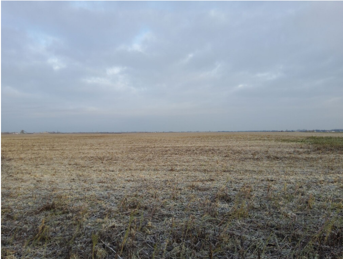
Nr. 331 bei Kauern - Blick nach Norden, Bruchfeld