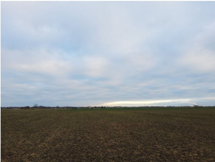
Schacht Nr. 7 - Überblick, Blick nach Osten