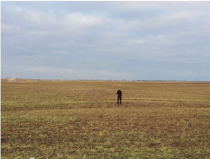
Kohlenbahn Tollwitz-Dürrenberg - Gut 20 bis 30m breiter gewölbten Damm, Blick nach Norden