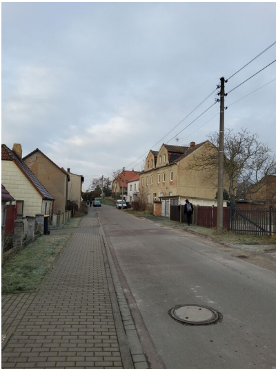
Steigerweg - Steigerweg, Blick nach Westen