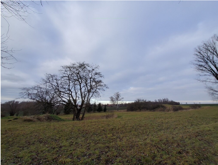
Privat-Braunkohlengrube S. Nr. 158 bei Kauern - Übersicht Grube mit Kippe, Blick nach Norden