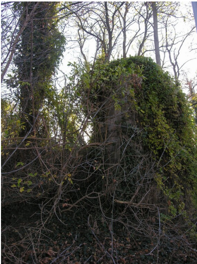
Aschebahn von der Saline zur neuen Halde - Bogenbrücke von 1836. Einziger verbliebener Pfeiler der Schienenbahn, die Salinenstraße querend, von den Siedehäusern zum Aschenberg führend. Muschelkalkquader und Ziegelmauerwerk.