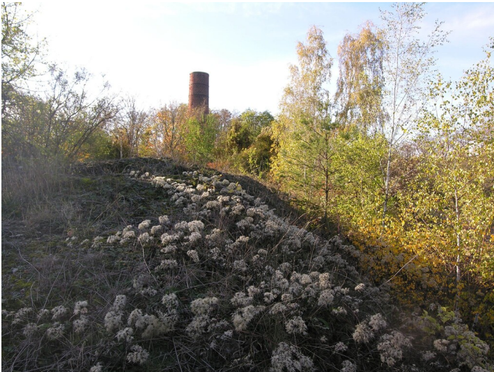
Aschehalde der Königlichen Saline Dürrenberg - Die Schüttung der älteren Aschehalde ist verwittert und weitgehend bewachsen. Im Hintergrund Schornsteinstumpf eines ehemaligen Siedehauses.