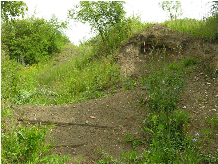
Der Aschenberg - Der Aschen-Berg, bloßgelegte Stellen entlang des BMX-Parcours.