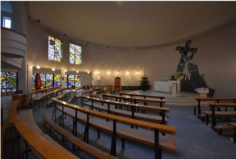
Katholische Kirche St. Bonifatius