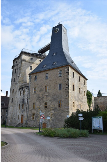
Witzleben-Turm - Witzlebenturm (links), Borlachturm (rechts)