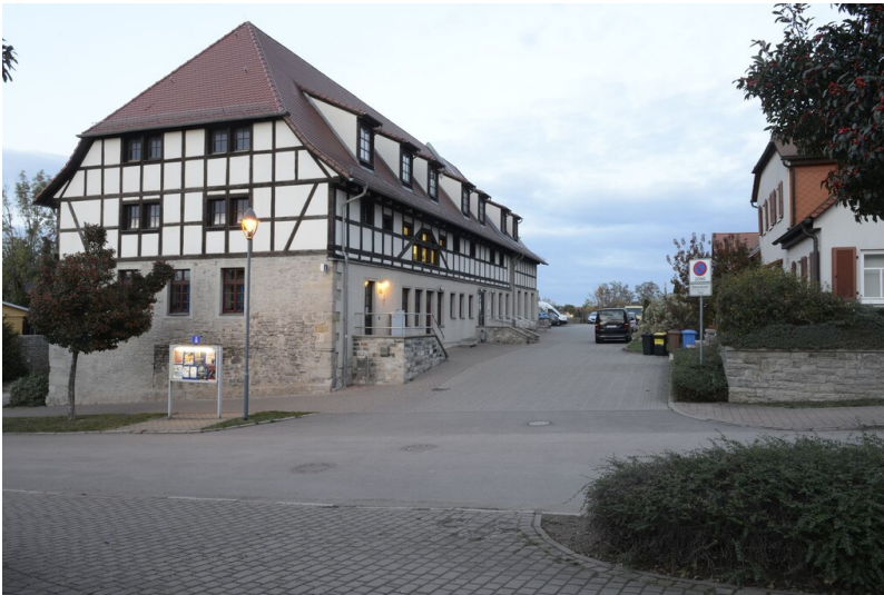
Ehemaliges Siedehaus der Saline Bad Dürrenberg