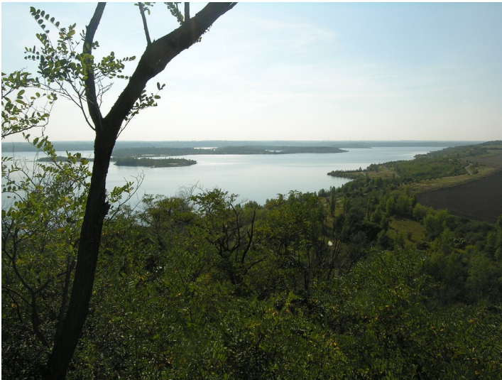
Geiseltalsee - Blick von der Halde Blösien über den Geiseltalsee und die Innenkippe