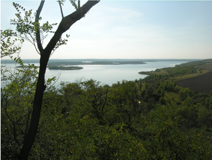
Geiseltalsee - Blick von der Halde Blößen über den Geiseltalsee und die Innenkippe