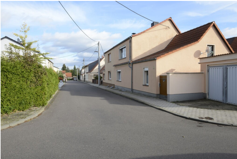
Bergmannssiedlung Blösien - Blick in die Straße "Bergmannssiedlung"