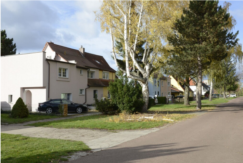
Siedlung "Puppensiedlung" Beuna - Blick entlang der Straße am Spielplatz