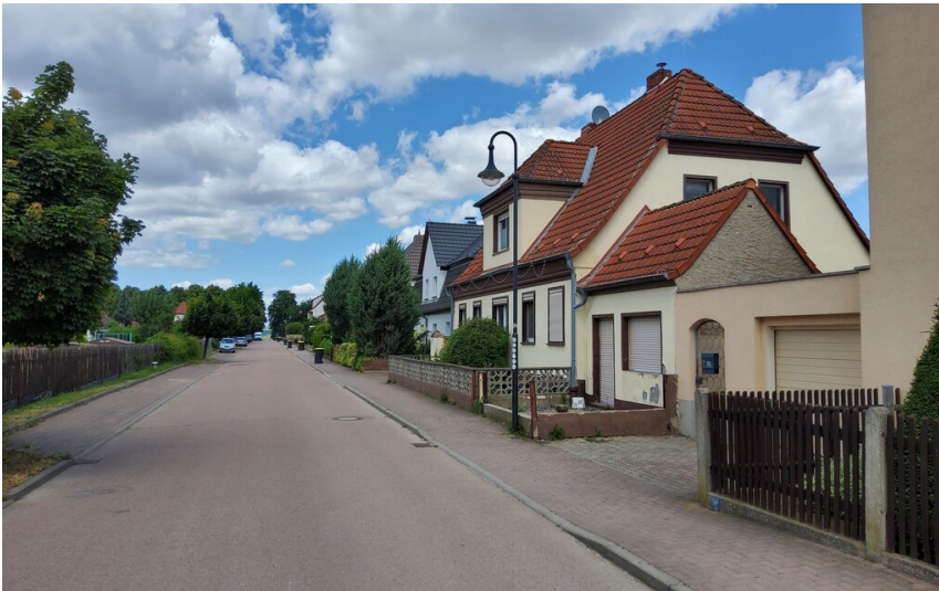
Neuansiedlung Neumark-Siedlung - Geiseltalstraße mit Blick nach Norden

Schlagwörter: Siedlung Fachsicht(en): Denkmalpflege Gemeinde(n): Braunsbedra Kreis(e): Saalekreis Bundesland: Sachsen-Anhalt