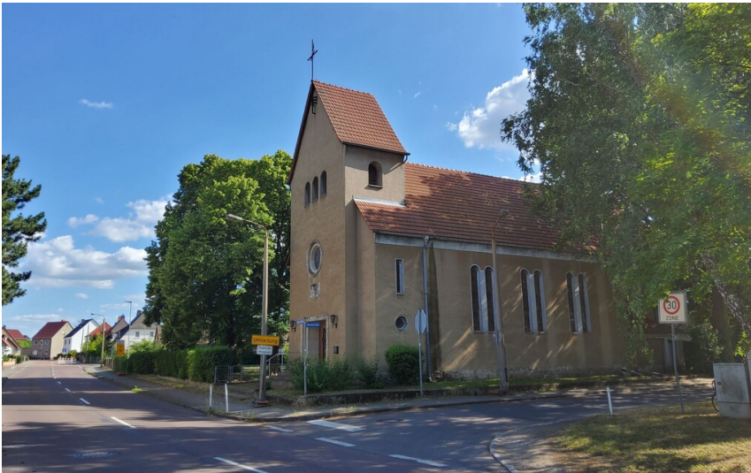
ehemalige katholische Kirche Heilige Drei Könige - Blick aus nördlicher Richtung