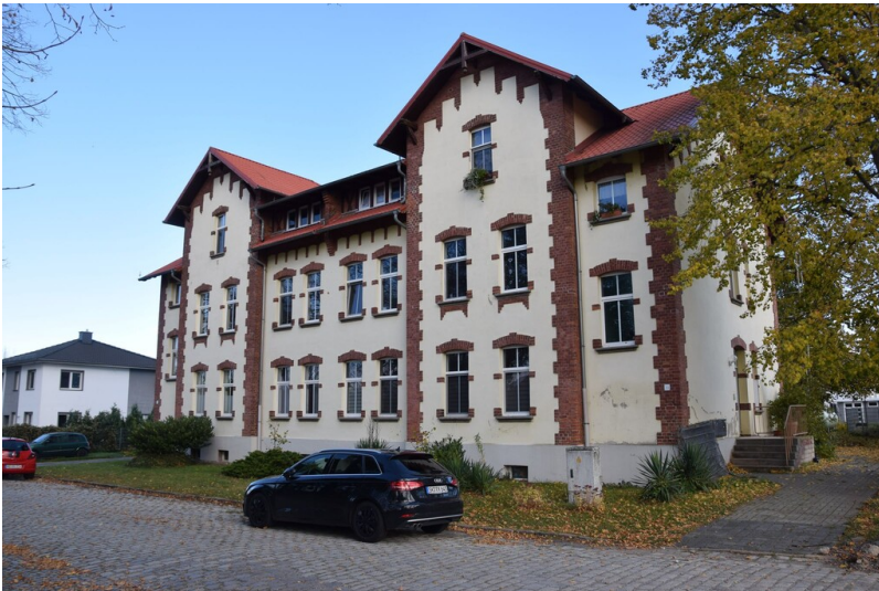
Verwaltungsgebäude der Brikettfabriken Michel und Vesta - Seestraße 33-34