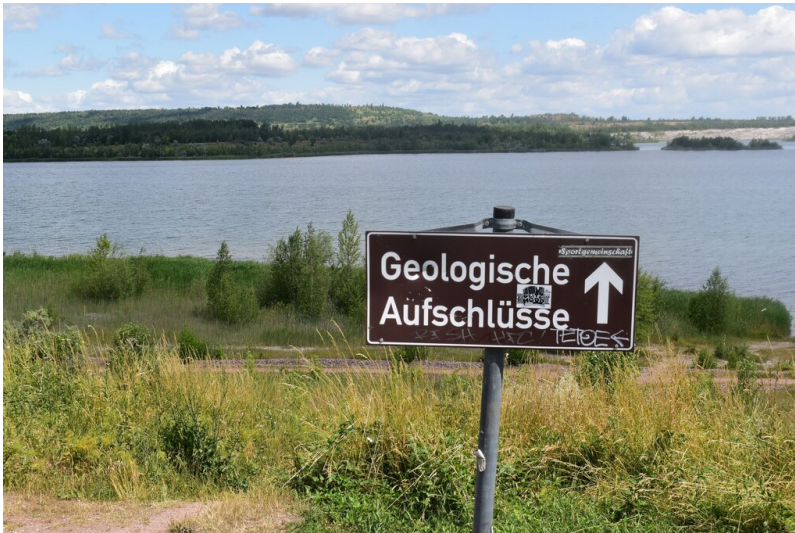
Geologische Fenster Südufer Geiseltalsee - hier geht es hinab zu den geologischen Fenstern in der Südböschung