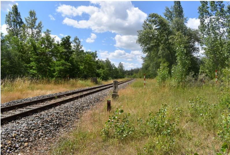
Innenkippendamm, Geiseldamm - Über den Kippendamm fand die Bahnstrecke ihr endgültiges Gleisbett