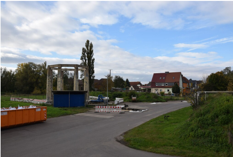
Gesamtstandort Brikettfabrik Pfännerhall - Blick auf Wasserturmrelikt und Siedlung