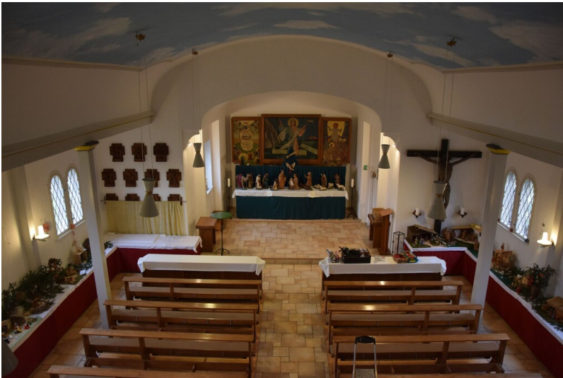
Geiseltalsee-Kirche, ehemals katholische Kirche Herz-Jesu Neubiendorf - Innenraum mit Blick zum Altar